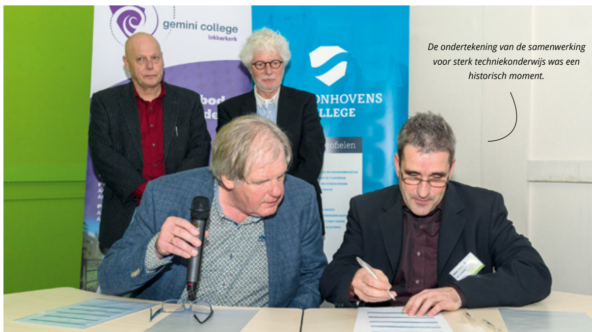
De ondertekening van de samenwerking voor sterk techniekonderwijs was een historisch moment.