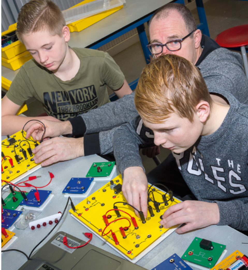
Jongeren aan de slag met elektronica.