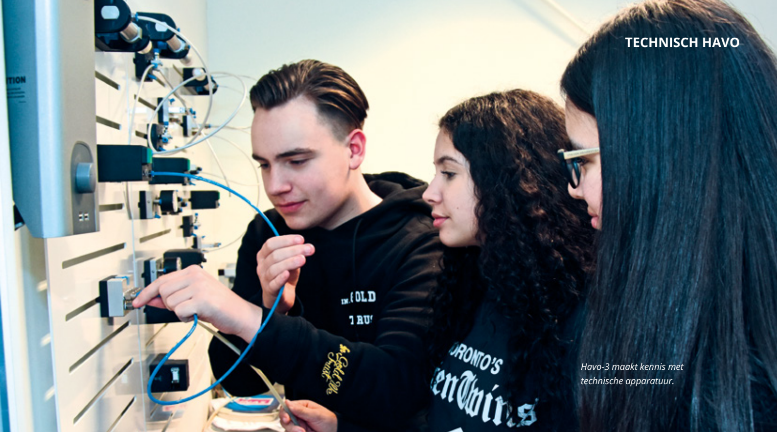
Havo-3 maakt kennis met technische apparatuur.

Technisch havo – snuffelen aan apparaten