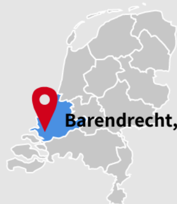
Barendrecht, Heerjansdam & Ridderkerk